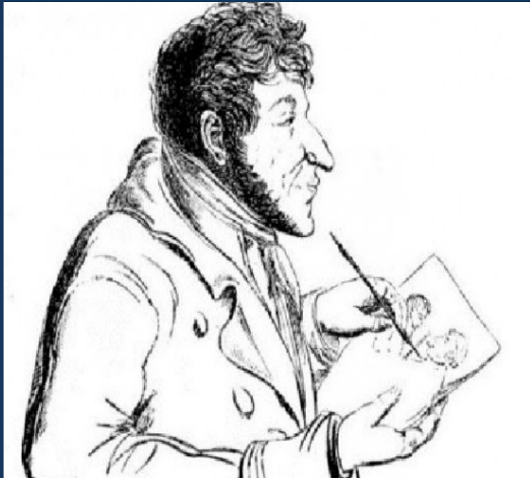
Е. Т. А. Хофман – автокарикатура

Електронната библиотека е съвкупност от електронни ресурси, организирани в електронна форма по библиотечен принцип (или по специален начин, нямащи отношение към библиотеката в традиционното разбиране на това понятие), т.е. на базата на известните правила и технологии на традиционното библиотекознание, включвайки комплектуването, обработката, систематизацията, предметизацията, съхранението и другите процеси и технологии, в това число – и създаване на каталог и справочно-информационен апарат.