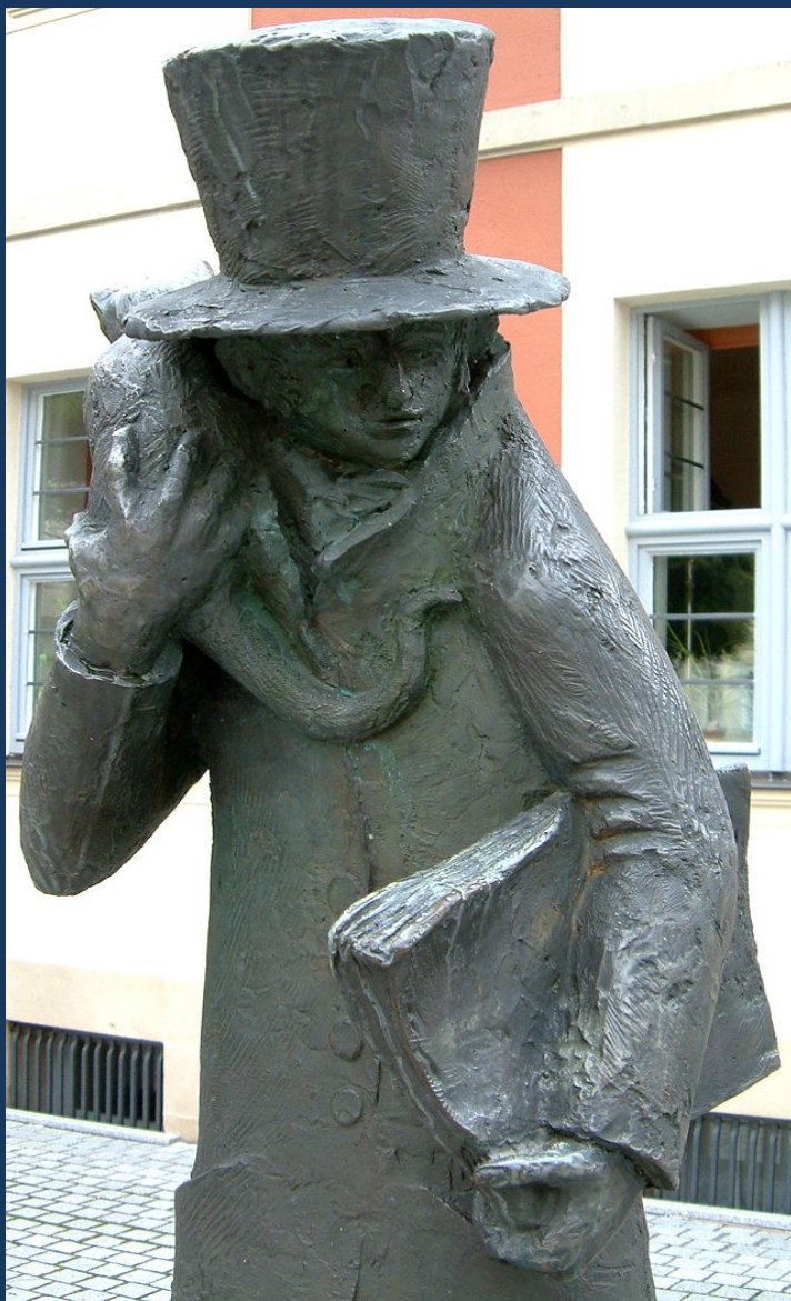
Статуя на Е. Т. А. Хофман в Бамберг (паметникът е открит 13 август 2007)