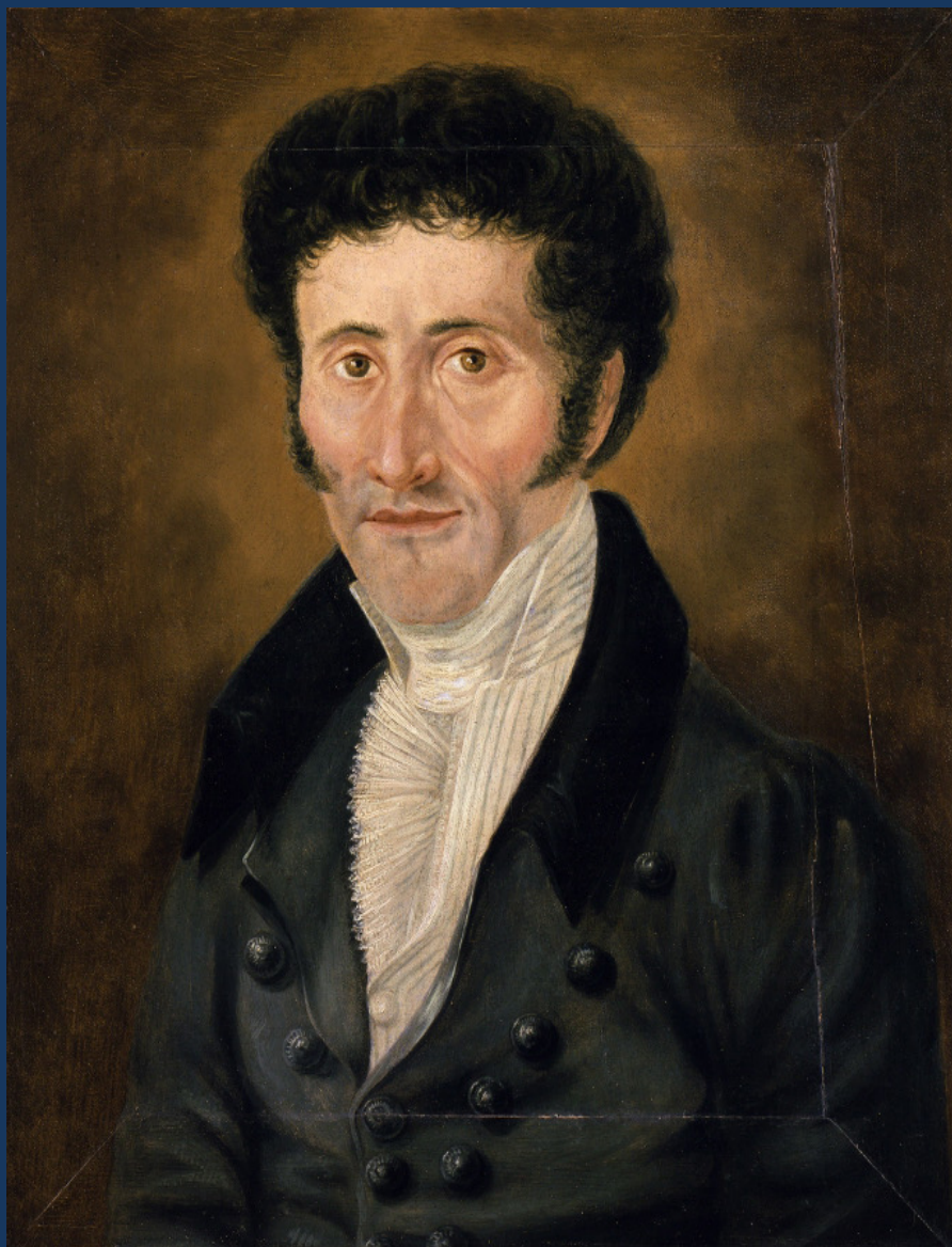
Автопортрет на Е. Т. А. Хофман (1776-1822) – платно (1822)