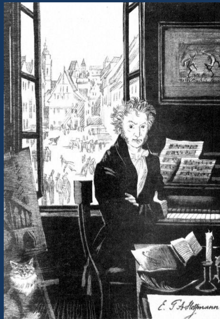
Е. Т. А. Хофман (1776-1822) – гравюра / Художник Ж. С. Дюпон (Ж. К. Дюпон) (1840)